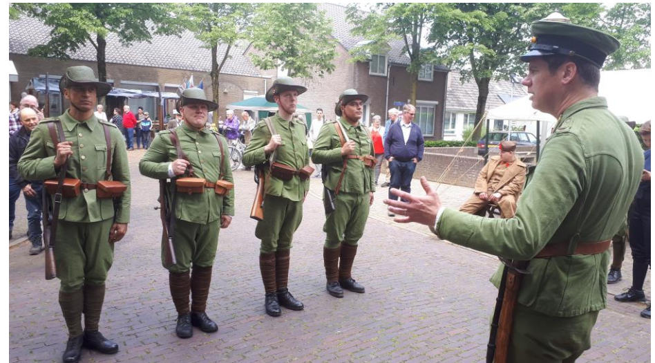
Infanterie X KNIL voor ons museum.

Veel geïnteresseerde bezoekers bezochten ons museum, het was weer een mooie dag.