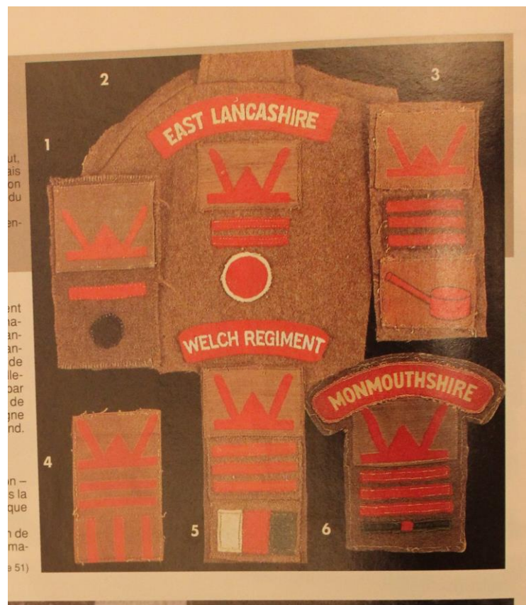
Emblemen van onze bevrijders.

Hierbij een voorbeeld van de emblemen gedragen door onze bevrijders.