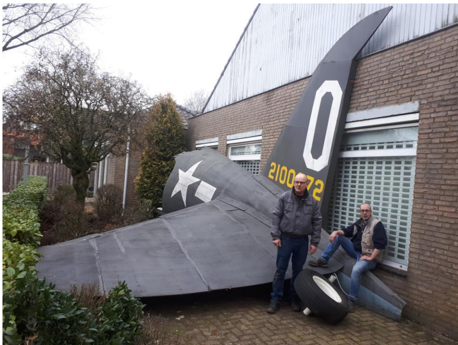
De replica van de "Clay Pigeon" die op 17 september 1944 boven Casteren neerstortte.