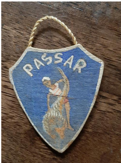
Badge van Truus Hobma.

In onze thematentoonstelling onder andere materialen van de familie Hobma-Gastra.